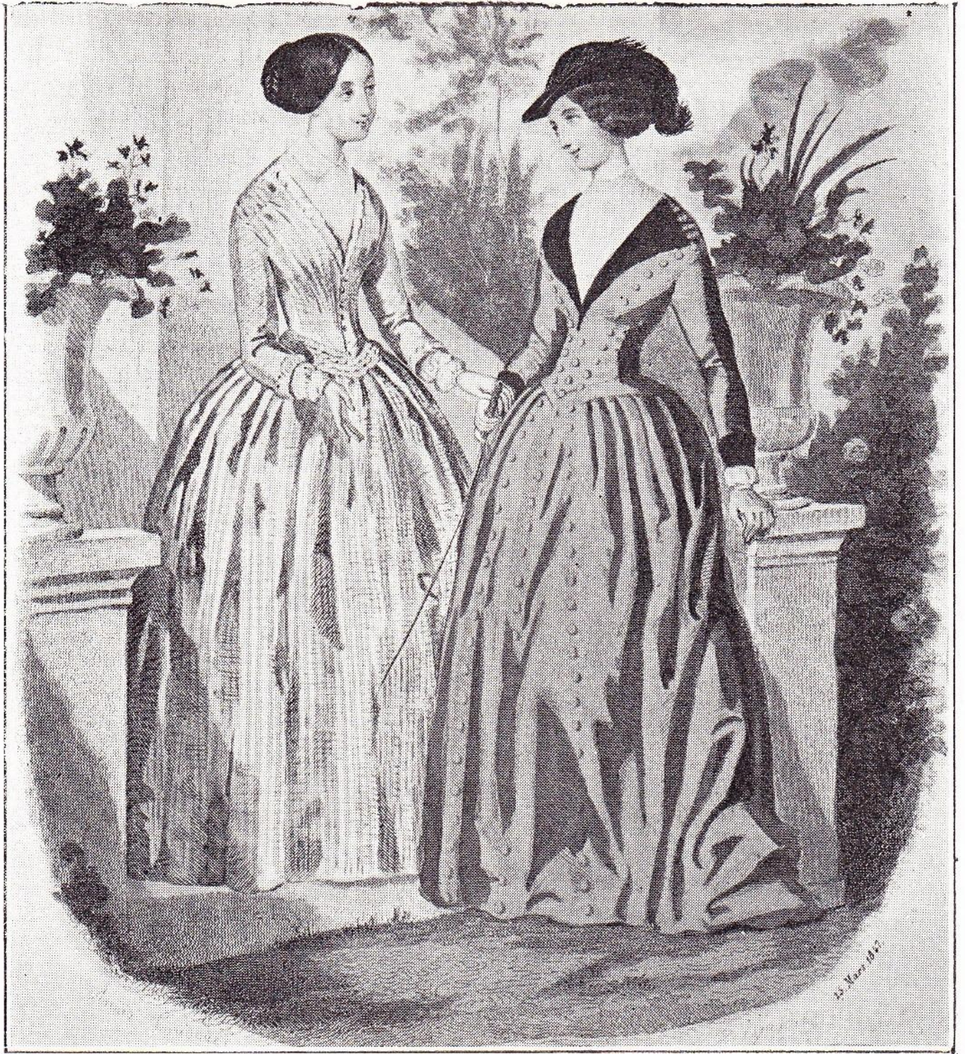
LA MODE EN 1847. Costume amazone. (D'après un dessin d'Anais Toudouze.)